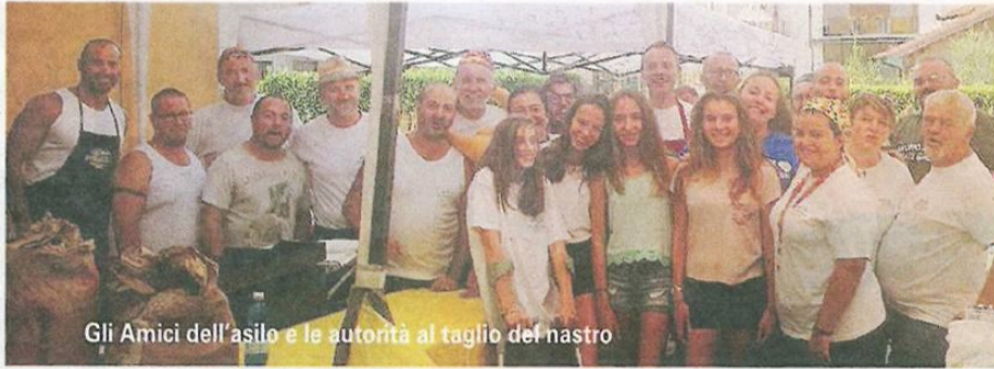
Gli Amici dell'asilo e le autorità al taglio del nastro